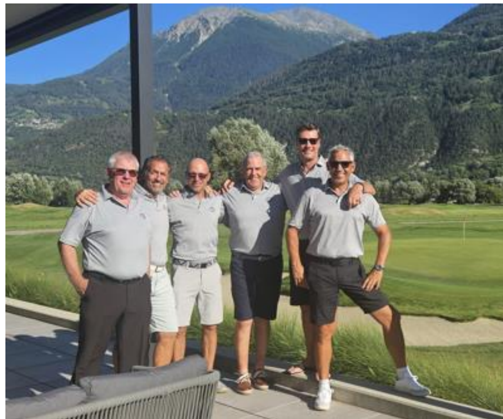
Interclub 2024 B3, Lipperswil